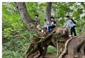
(写真は月山での「生物巡検」)