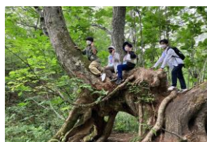
(写真は月山での「生物巡検」)