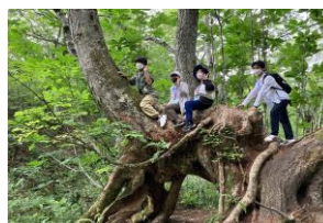
（写真は月山での「生物巡検」）