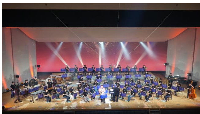
吹奏楽部定期演奏会（令和5年5月）

令和4年7月に行われた宮城県吹奏楽コンクールで金賞を受賞し、青森県で開催された東北大会に出場しました！東北大会では銀賞を受賞しました。令和5年5月には第44回定期演奏会をトークネットホール仙台で開催し、素晴らしい演奏と多彩なステージで観客を魅了しました。